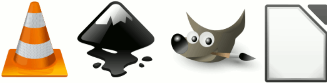
VLC, Inkscape, GIMP, LibreOffice

Hopelijk heeft dit iemand anders ook zin gegeven om de oude iMacs te blijven gebruiken.