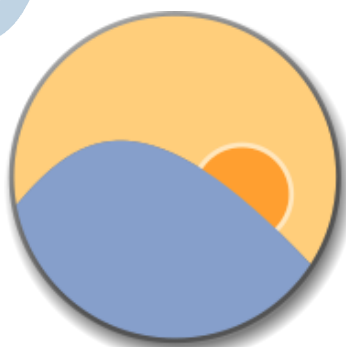
f.lux voor je ogen

Ja, de Windows versie moet nog geactiveerd worden. Die stap heb ik nog niet uitgevoerd. Deze computer gaat naar een kennis. Hun dochter zit net op school. Dat betekent dat zij heel goedkoop of gratis een Windows licentie kunnen aanschaffen. Daar wacht ik dus nog even mee.