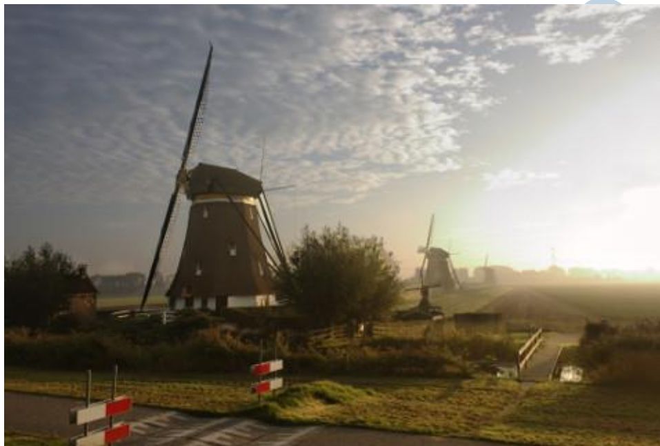
De derde molen van de Tweemanspolder bij Zevenhuizen

https://magazine.helpmij.nl/uploads/2015/12/IMG_1130.CR2