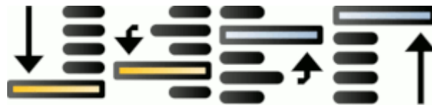
Objecten omhoog en omlaag verplaatsen

De objecten botsen nooit, ze liggen boven en onder elkaar. Met de knoppen in de gereedschaps details verplaats je de objecten ten opzichte van elkaar.