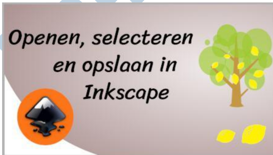
YouTube video Openen, selecteren en opslaan in Inkscape

Het standaard formaat waarmee Inkscape werkt, is svg . Svg staat voor Scalable Vector Graphic. In de volgende video zie je het selectiegereedschap in actie. Verder wordt er uitgelegd hoe je een bestand opent en opslaat als svg.