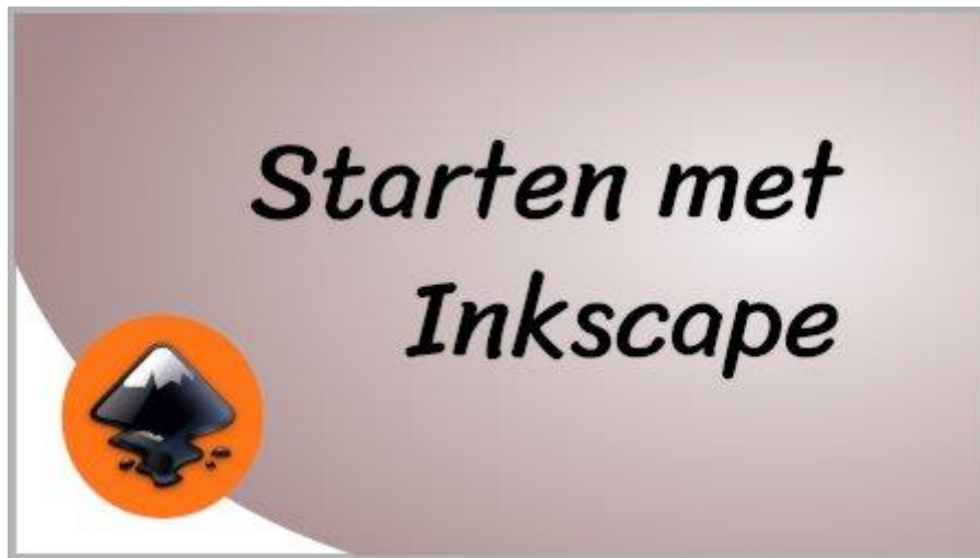
YouTube video Starten met Inkscape

Als je nog nooit hebt gewerkt met een vector tekenprogramma, kan het wat overweldigend zijn als je Inkscape voor het eerst opstart.