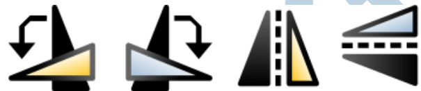
Draaien en spiegelen

De knoppen ernaast draaien en spiegelen een selectie: