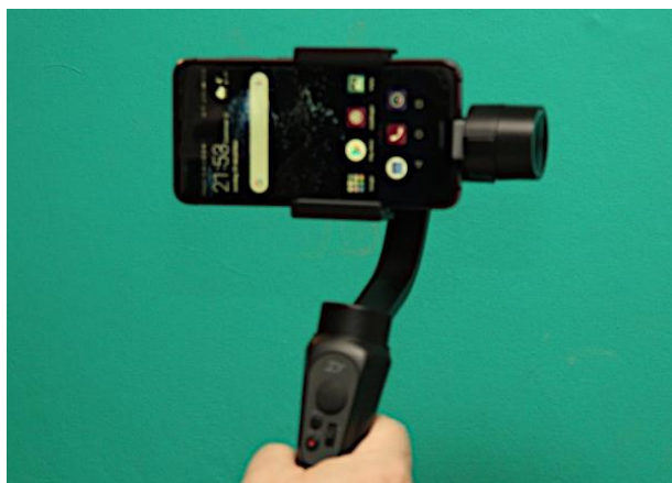
Zhiyun Smooth-Q gimbal met drie-assige stabilisatie via 3 kleine motortjes