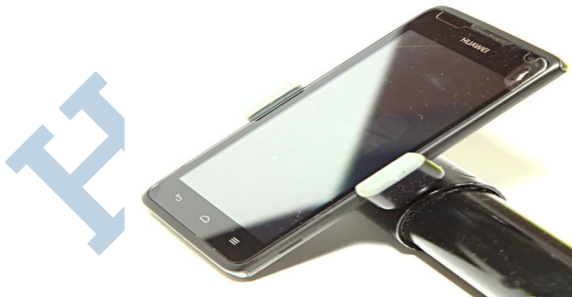
Simpele steun met een selfiestick klemmetje en wat 25 mm PVC pijp

Hou je mobiel om te beginnen horizontaal bij het filmen! Dan speelt hij mooi af op je TV of computer. Verticaal opnemen is geen goed idee. Dan is het verder de kunst onder het filmen niet te veel te bewegen. Een selfie stick of een van de steuntjes voor in je auto ombouwen tot een simpele handgreep is vaak al een hele verbetering. Dan kan je ook nog steun zoeken aan een pilaar of ander object. Dat speelt vooral als je stilstaande objecten aan het filmen bent. Een stel jongelui op skates is minder kritisch.