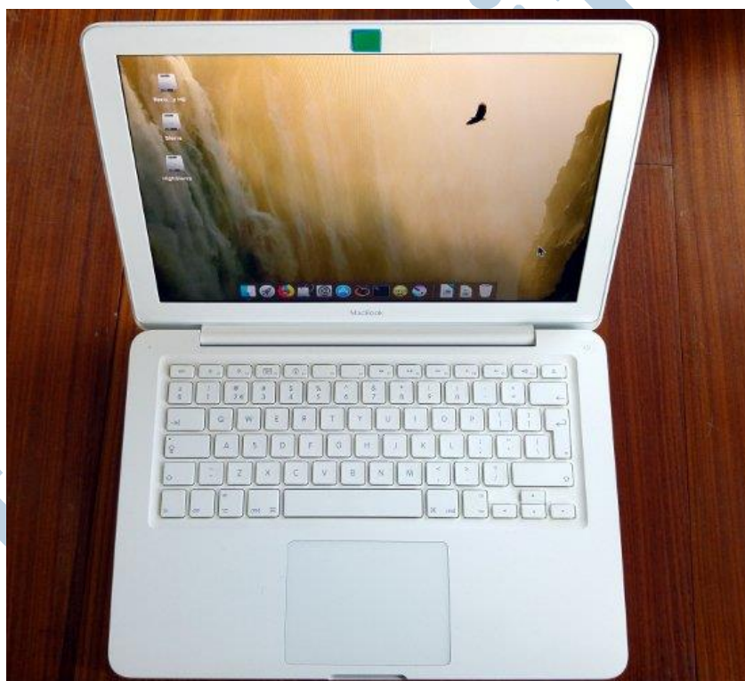
De MacBook 7,1 uit 2010

Die oudere laptops zijn open te schroeven aan de onderkant en de harde schijf en het RAM geheugen zijn goed bereikbaar én vervangbaar. Kon er vroeger maximaal 4 GB RAM in, tegenwoordig kan dat nog uitgebreid worden tot 16! Dat alles met een SSD schijf, waardoor de laptop in 20 seconden opstart. Dat waren wat redenen om de laptop aan te schaffen. Natuurlijk ziet de laptop er ook ontzettend mooi uit en het toetsenbord typt lekker. Er zitten fijn veel aansluitingen op, plus een dvd-speler. En het geluid wat eruit komt tijdens het kijken van een film is echt indrukwekkend. Ik was gewoon heel nieuwsgierig waarom mensen nu zo merkvast zijn wat betreft Apple. Het moet gewoon werken! hoor ik heel vaak. En in mijn omgeving zitten veel designers en kunstenaars. Die werken ook vaak met Apple, in combinatie met Adobe CC.