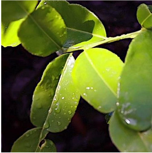
Djeroek Poeroet (Limoen)

Of je er beter uitkomt als ik in ons kruidenrek duik met rare woorden als djeroek poeroet, ik zou het niet weten. Dat zijn limoenblaadjes en hoogst nuttig voor sommige gerechten uit de Indonesische keuken. Maar smakelijk is nog niet veilig vrees ik.