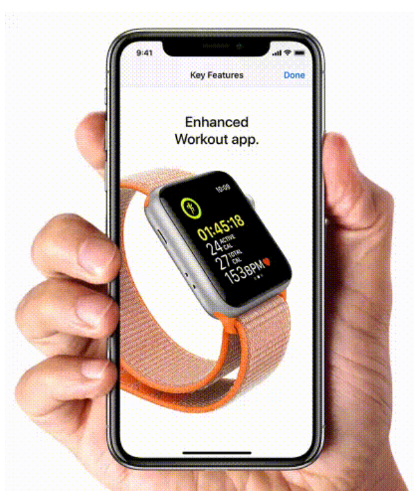
GIF van Apple

De meeste gebruikers weten wel hoe je een schermafbeelding maakt met je mobieltje. Bij de oudere iPhones druk je de sluimerknop (bovenop of aan de zijkant) en de thuisknop tegelijkertijd even in. Bij de nieuwere iPhones (zonder fysieke home-knop) druk je tegelijkertijd op de sluimerknop en de volumeknop. In beide gevallen hoor je dan een sluitergeluid en wordt de afbeelding naar de linker benedenhoek van het scherm gezonden: