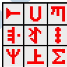
Het pictogram van Babelmap